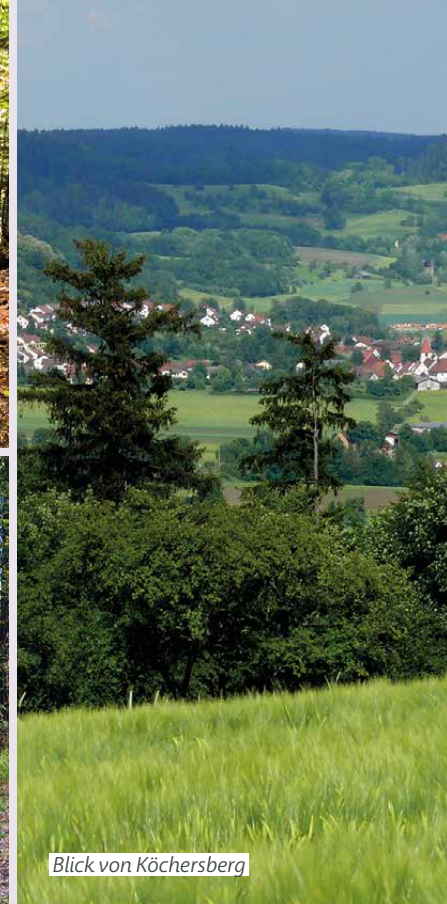
Blick von Köchersberg