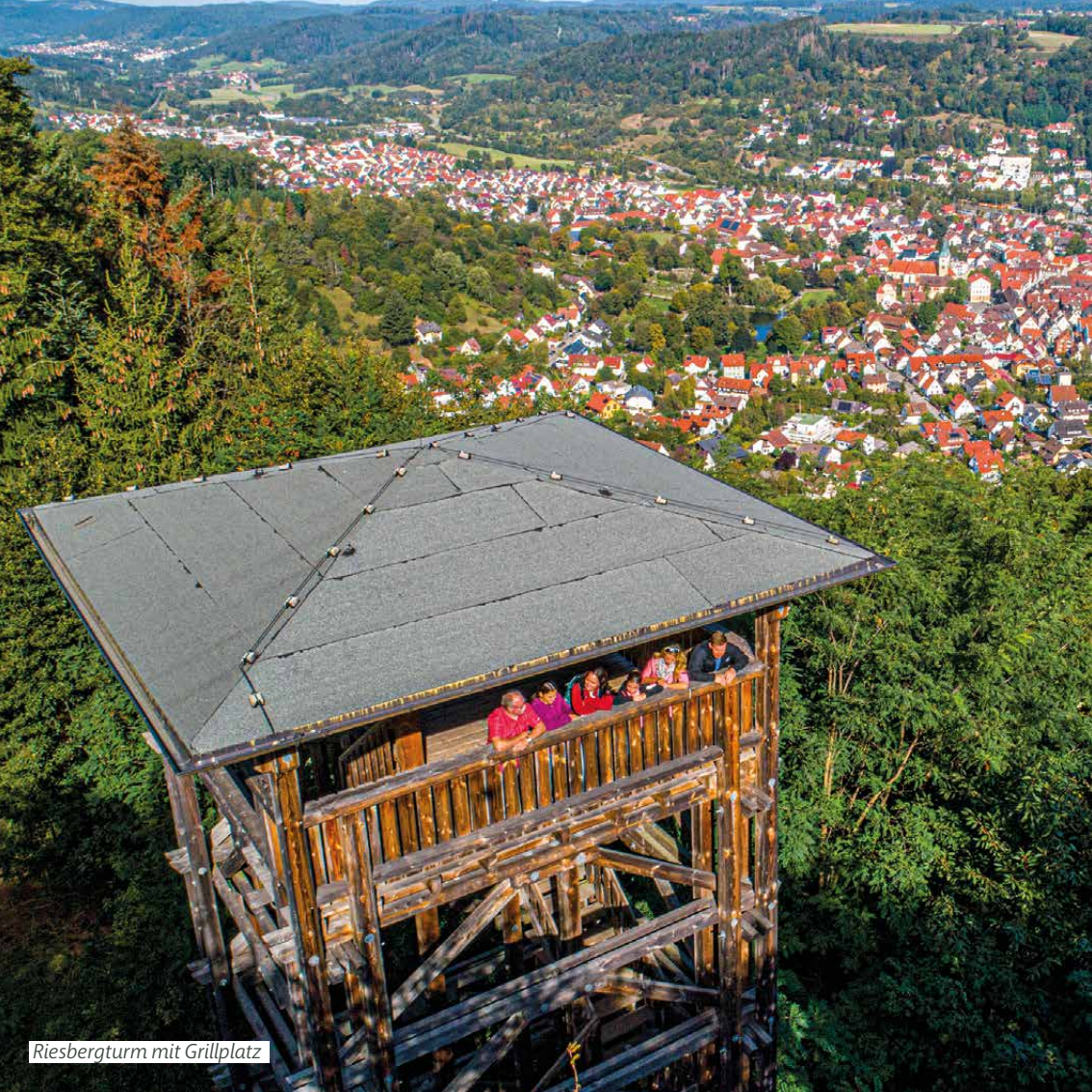
Riesbergturm mit Grillplatz