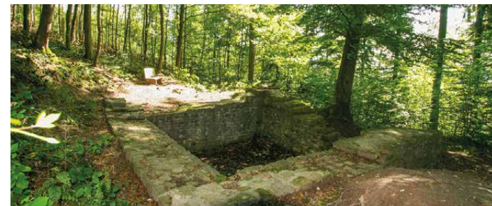
Limesturm am Linderst