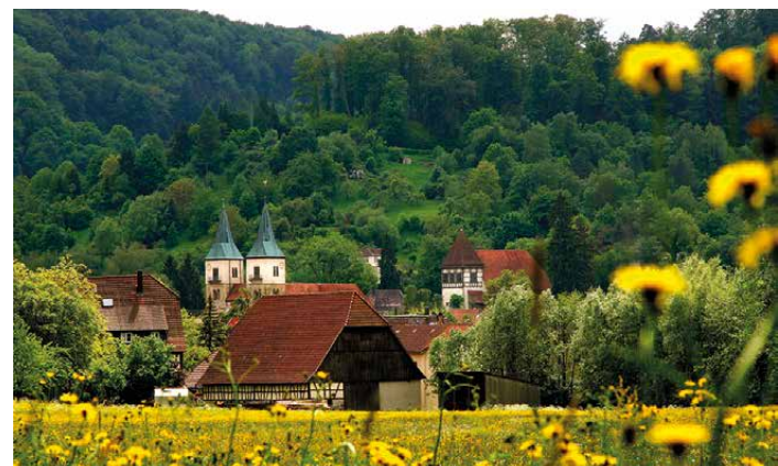
Blick auf Murrhardt

Kouzina Taverna Restaurant Rudi-Gehring-Straße 21 Telefon 0 71 92 / 84 50 Kein Ruhetag