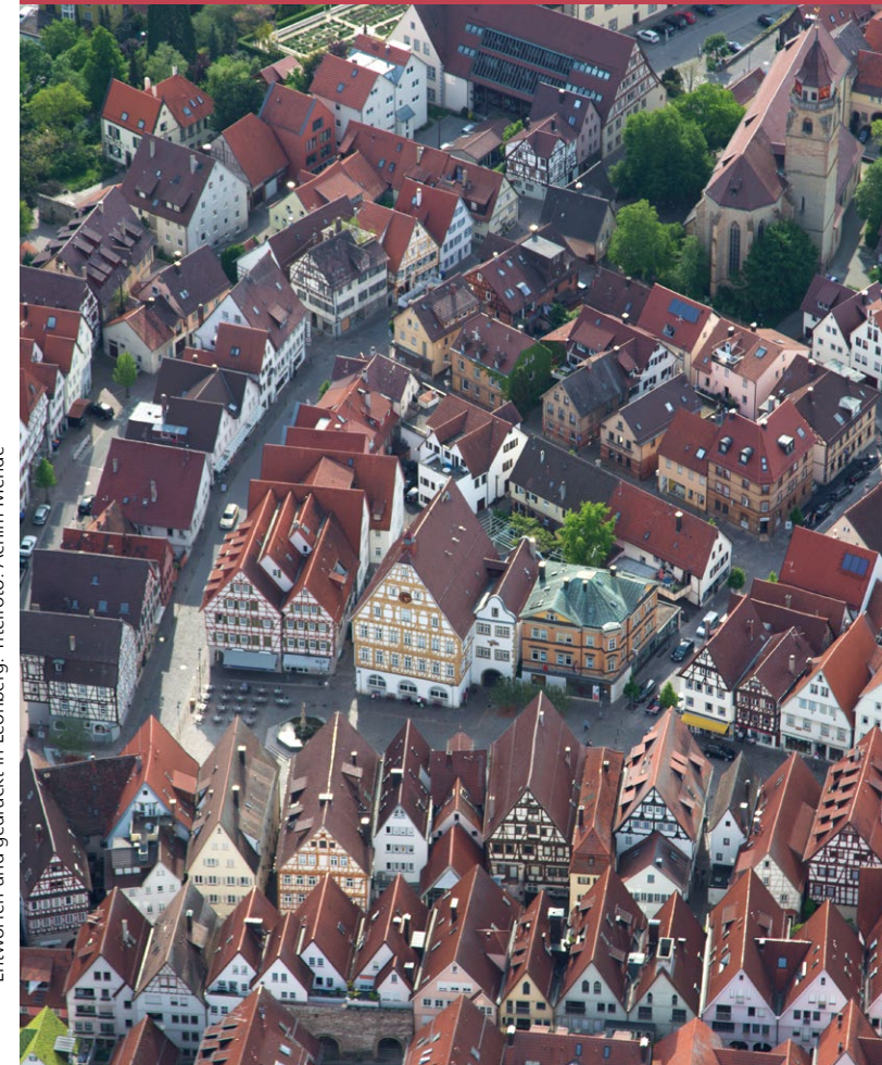
Entworfen und gedruckt in Leonberg.