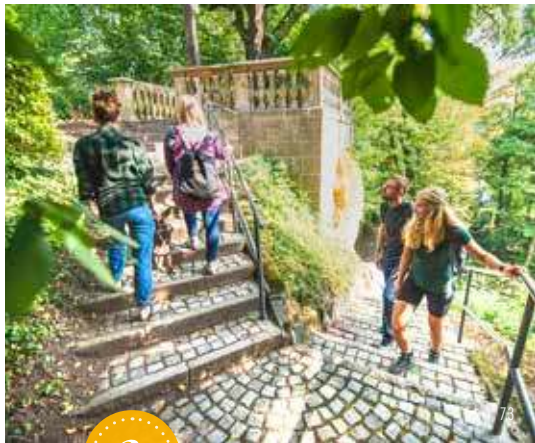
Kreuzweg auf den St. Salvator