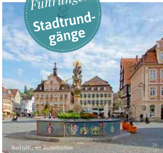
Marktplatz mit Marienbrunnen