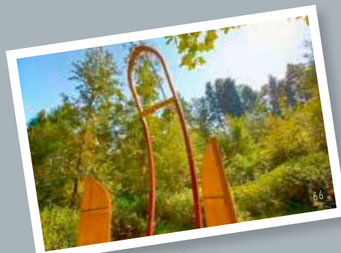
Station auf dem „LebensWeg“