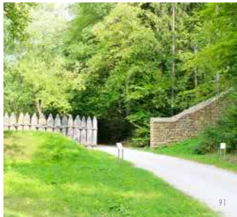
Obergermanischer Limes und rätische Mauer