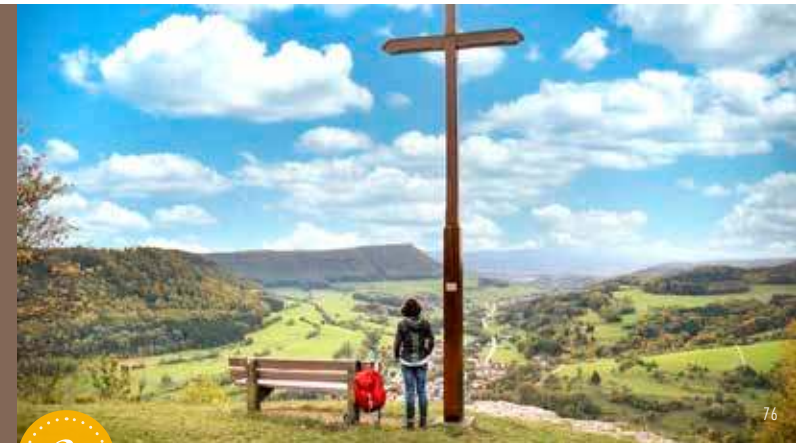
Aussichtspunkt am Galgenberg