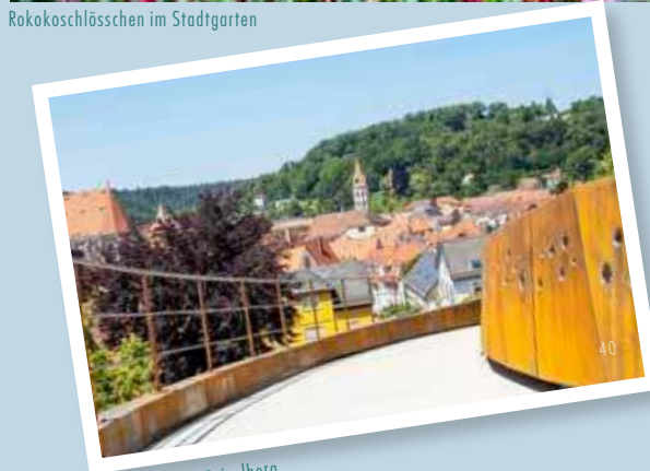
Aussicht vom Zeiselberg

www.schwaebisch-gmuend.de/pfade-und-wege.html