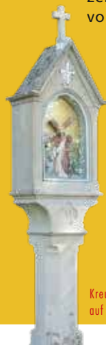
Kreuzwegstation auf dem Hohenrechberg