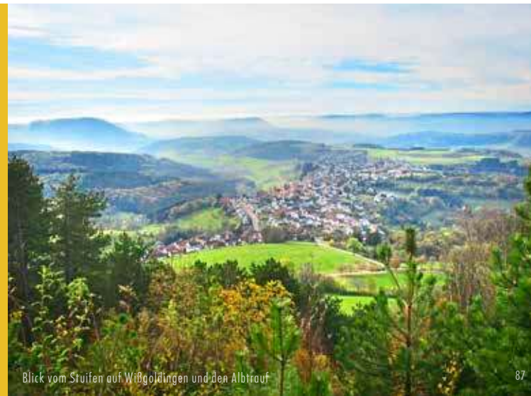
Blick vom Stufen auf Wißgoldingen und den Albrauf