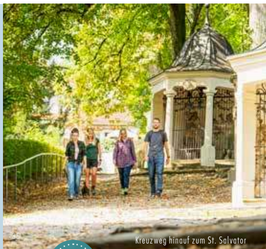
Kreuzweg hinauf zum St. Salvator