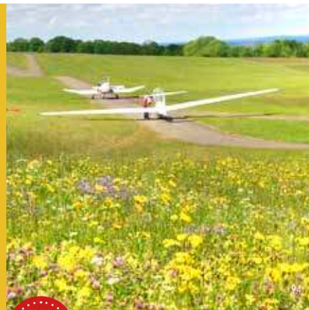
Segelfluggelände am Hornberg