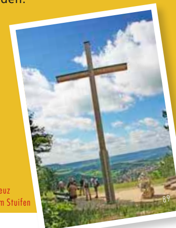
Das Kreuz auf dem Stufen

Am einfachsten lässt sich der Stufen bei einer kleinen Rundwanderung mit Start am Wanderparkplatz in Wißgoldingen erkunden.