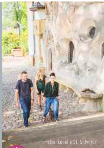
Felsenkapelle St. Salvator