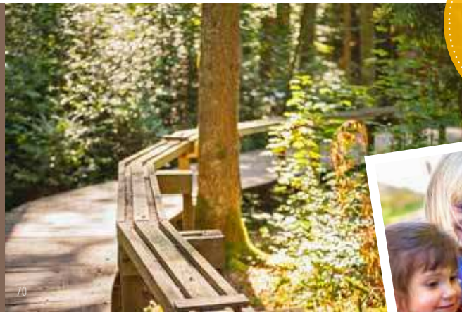
Waldkugelbahn im Taubental