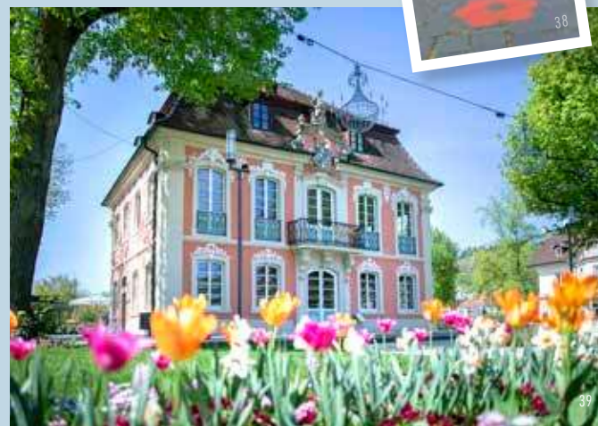
Rokoschlosschen im Stadtgarten