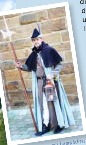
Stadtrundgang mit Turmwächter