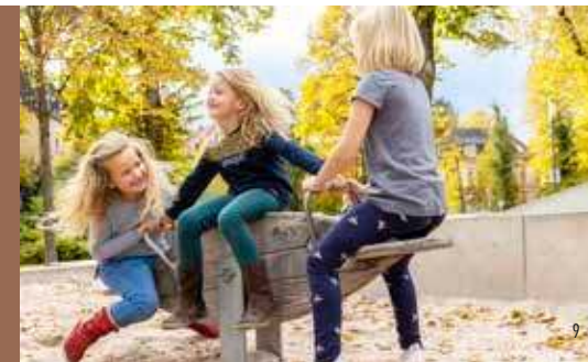
Grünes Netz in der Grabenallee