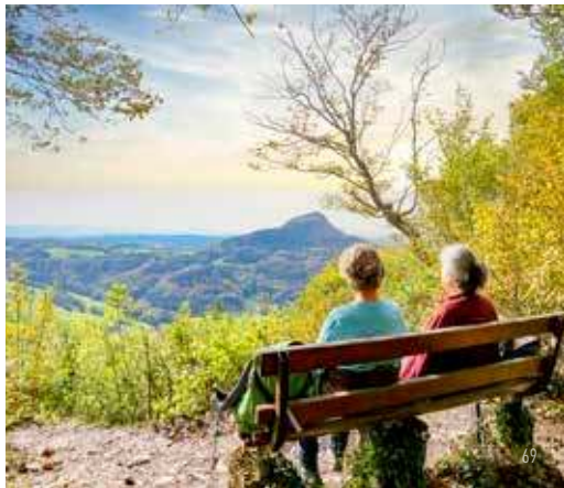
Aussichtspunkt am Hornberg