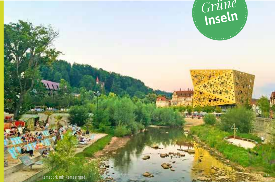
Remspark mit Remsstrand

Angelehnt an den maurischen Garten der legendären Alhambra bietet die Grünanlage am Sebaldplatz herrliche Sitzmöglichkeiten, um mal wieder einen Gang zurückzuschalten. Und ganz nebenbei versprühen die Springbrunnen in den heißen Sommermonaten ihren kühlen Charme.