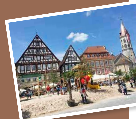
Spielplatz oberer Marktplatz