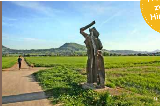
Wege zur Kunst