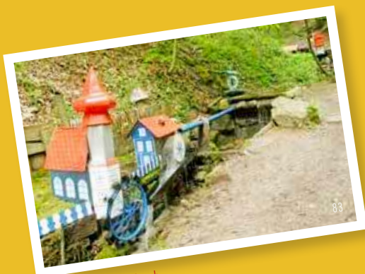
Schelmenklinge in Lorch

Erkunden Sie das Stauferland und begeben Sie sich auf eine spannende Spurensuche in die Vergangenheit. Die älteste Stauferstadt Schwäbisch Gmünd mit der beeindruckenden Stauferbasilika, der Johanniskirche, die Klosteranlage in Lorch , das Wäscherschloss und die Dreikaiserberge sind immer einen Ausflug wert, um die Geschichte der Staufer-Dynastie hautnah zu erleben!